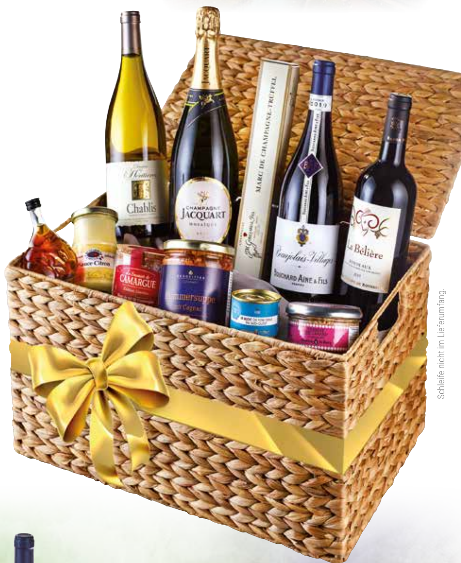
Schleife nicht im Lieferumfang.